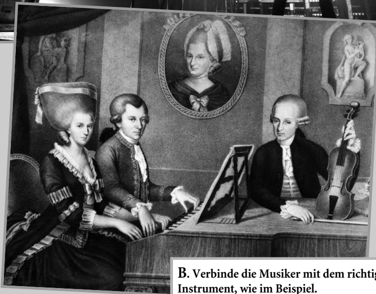
Mozart spielt Klavier

B. Verbinde die Musiker mit dem richtigen Instrument, wie im Beispiel.