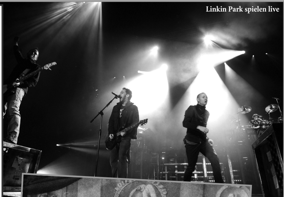
Linkin Park spielen live

Früher ..... man Musiker nur in Konzerten sehen. Heute ..... man Musiker auch im Fernsehen und Internet sehen.