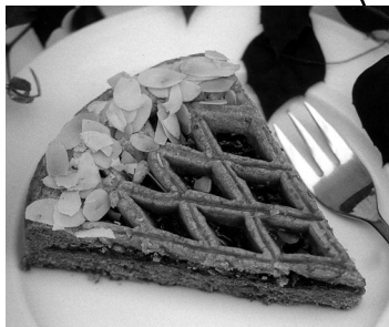
Die Linzer Torte ... lecker!