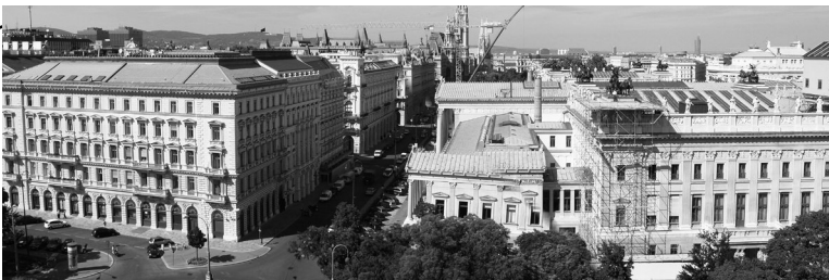
Wien, die Hauptstadt von Österreich