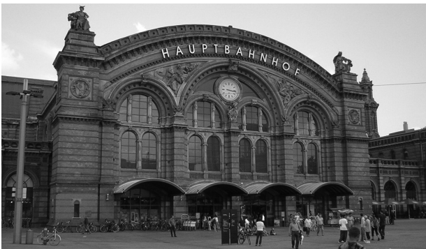
Der Bremer Hauptbahnhof